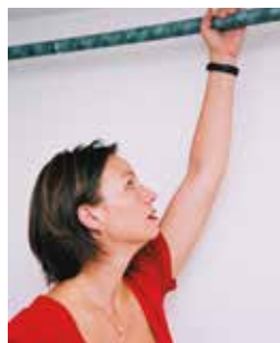
Prüfen Sie den Sitz der Halterung.

Erdgasleitungen sind oft mit Halterungen an der Decke befestigt und verlaufen frei im Raum. Überprüfen Sie, ob diese noch fest sitzen. Unzureichende Befestigungen können dazu führen, dass Leitungsverbindungen undicht werden.