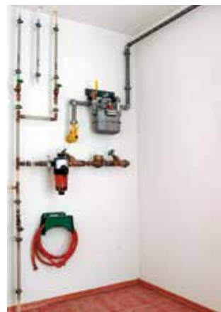
Freier Zugang ermöglicht schnelles Absperrnen.

Damit dies schnell möglich ist, muss diese Hauptabsperreinrichtung immer frei zugänglich sein. Daneben darf aber auch der Zugang zum Erdgaszähler nicht durch Gegenstände verstellt sein.