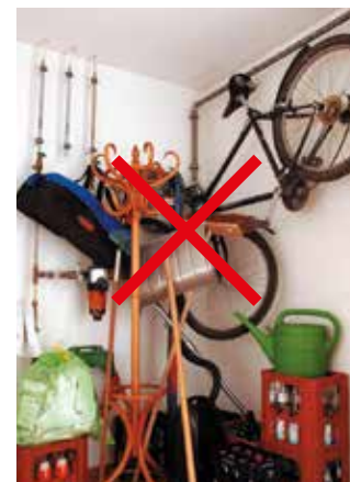
Wer hier erst räumen muss, verliert unnötig Zeit.