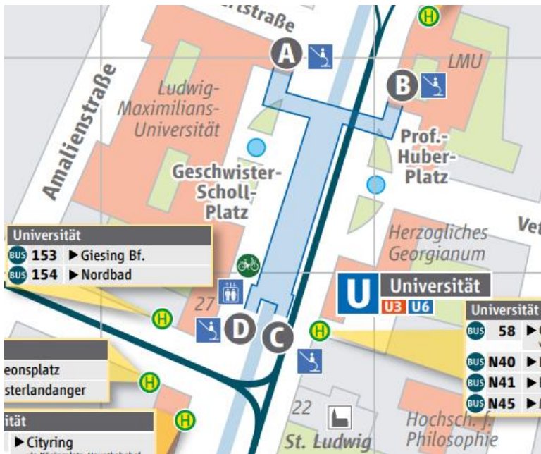
Lage Universität ( U-Umgebungsplan Universität (mvg.de) )

Aufgrund der Lokalität dient der U-Bahnhof Universität als ein zentralen Umsteigepunkt für Studenten der LMU und Besucher des englische Gartens. Das Sperrengeschoss dient als Aufgang zum Geschwister Scholl Platz und zum Prof. Huber-Platz.