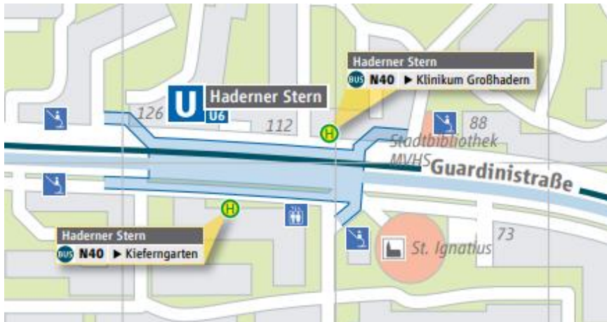
Lage Haderner Stern ( U-Umgebungsplan Haderner Stern (mvg.de) )

Der U-Bahnhof Haderner Stern befindet sich an der Gardinistraße im Stadtteil Kleinhadern. Neben der U-Bahnlinie U6 ist der Standort durch die Buslinie N40 an das öffentliche Nahverkehrsnetz angeschlossen. Der Standort ist an den Haderner Stern angebunden. Dies ist eine Wohnanlage mit integrierten Nahversorgungszentrum, welcher vom Architekten Peter Lanz geplant und 1976 fertiggestellt wurde.