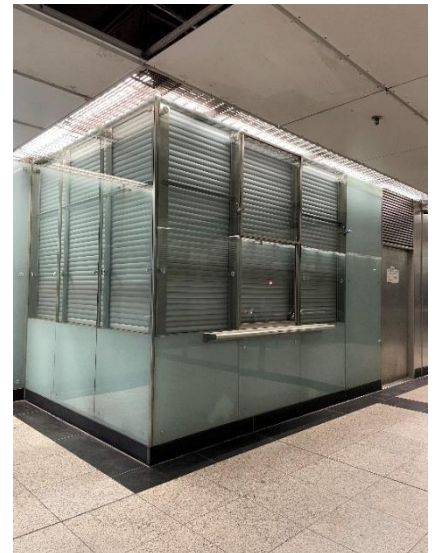
Innen- und Außenansicht